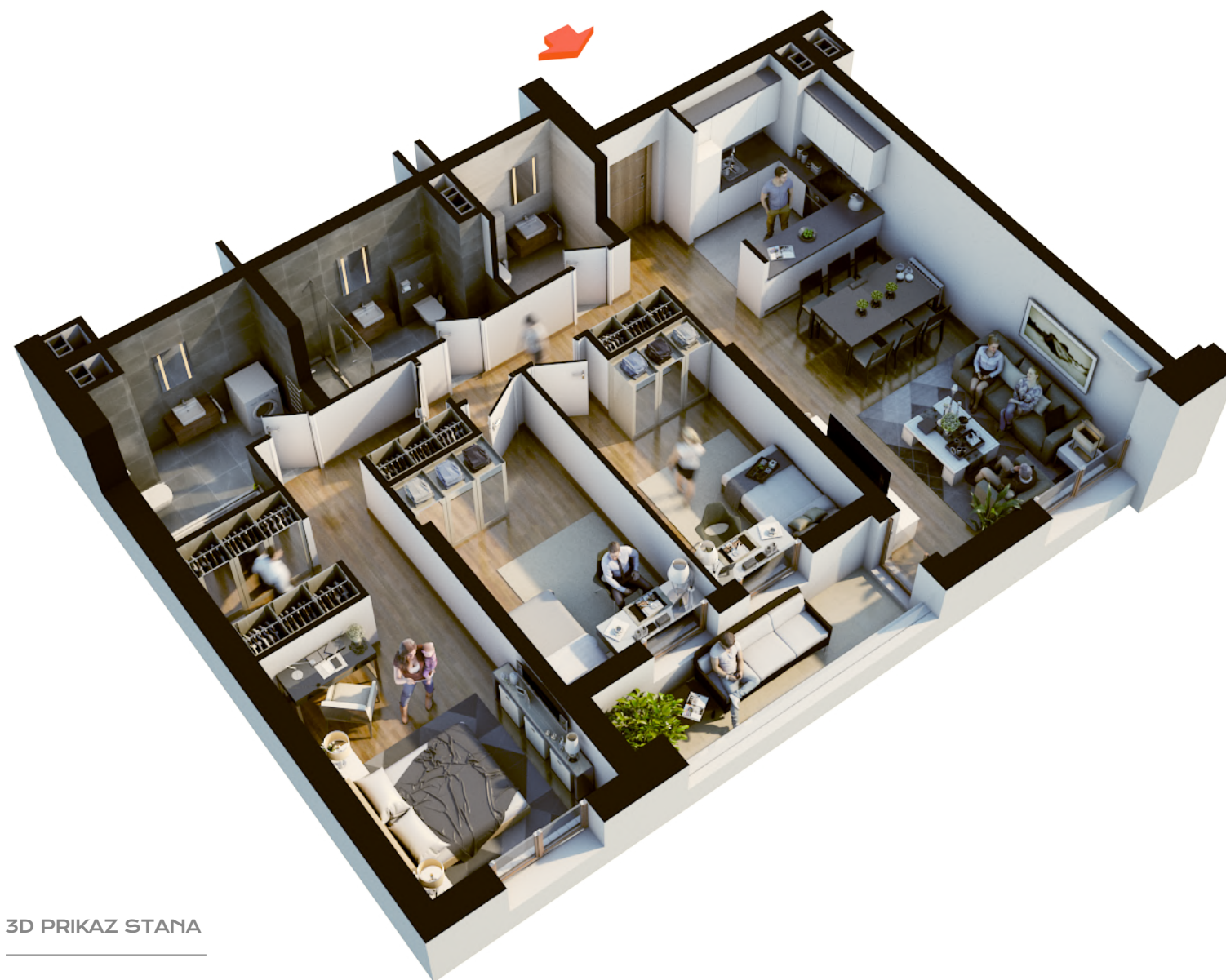
3D PRIKAZ STANA